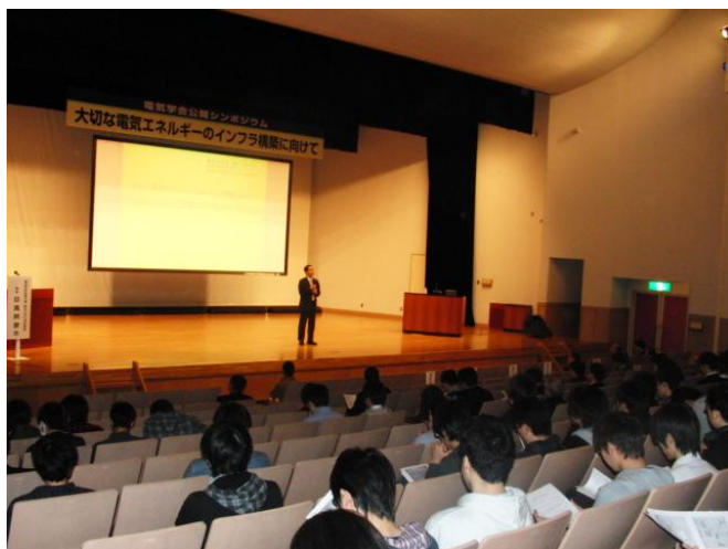
日高会長代理の挨拶